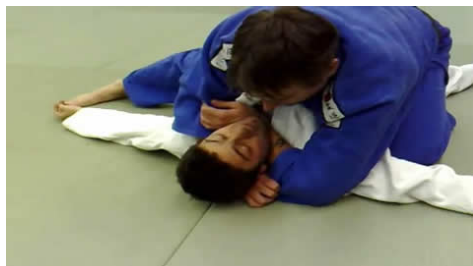
Sode guruma jime